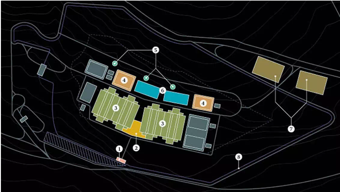
Distribución del Centro de Datos de Utah

Algún tiempo atrás, los EEUU tuvieron problemas con Alemania y Brasil al comprobarse públicamente que los mandatarios y altos oficiales de sus gobiernos eran espiados por el país norteamericano.