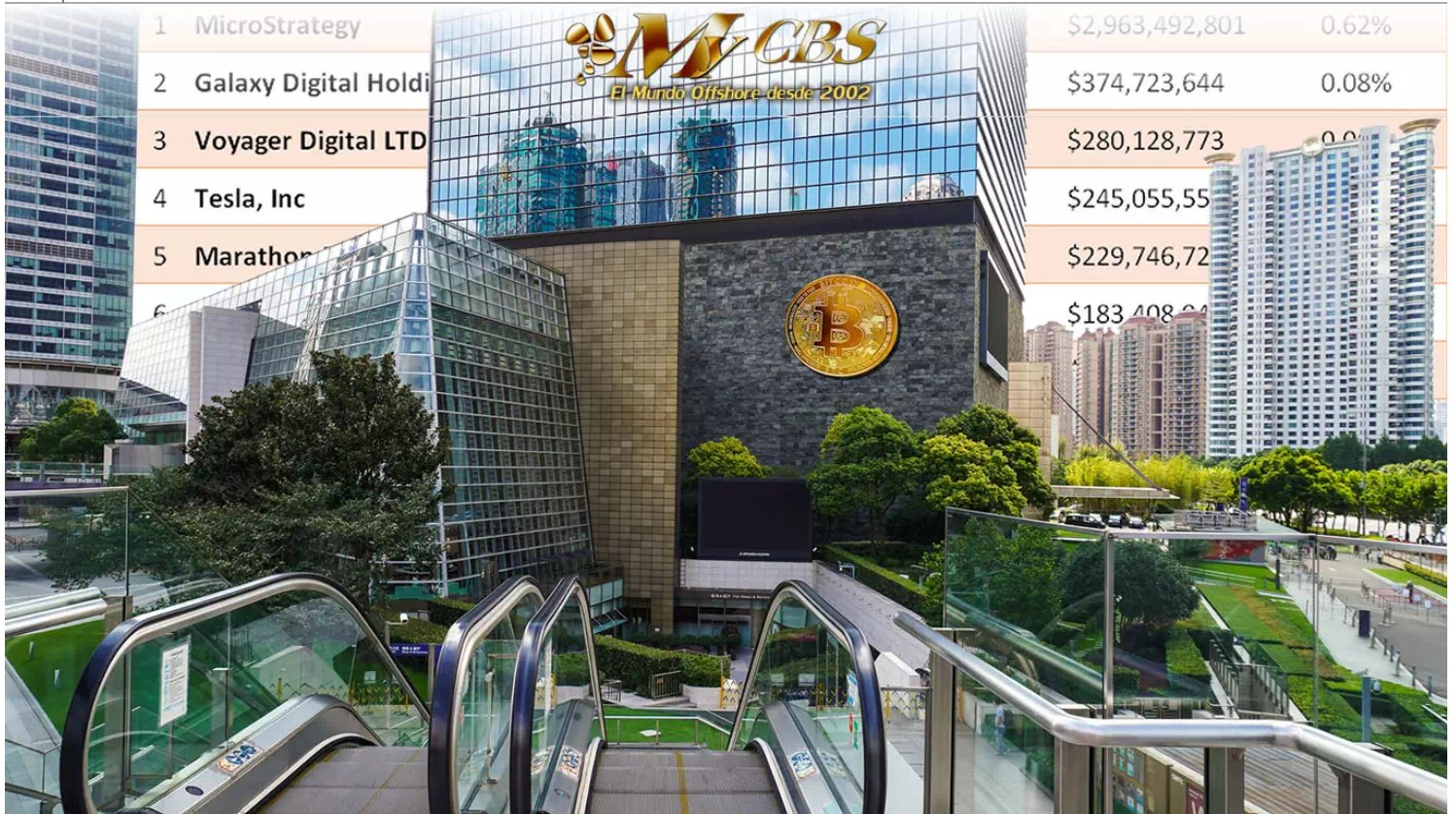
Instituciones en todo el mundo están invirtiendo en Bitcoin.

BITCOIN | VALOR | INVERSIÓN | EMPRESAS | ACTIVOS