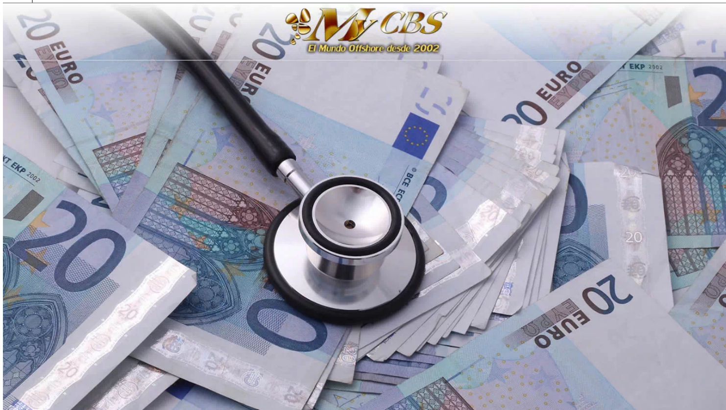
Es necesario que peses los costos de constituir tu compañía offshore internacional

IBC | OFFSHORE | IMPUESTOS | ESTRUCTURAS | REFUGIOS FISCALES