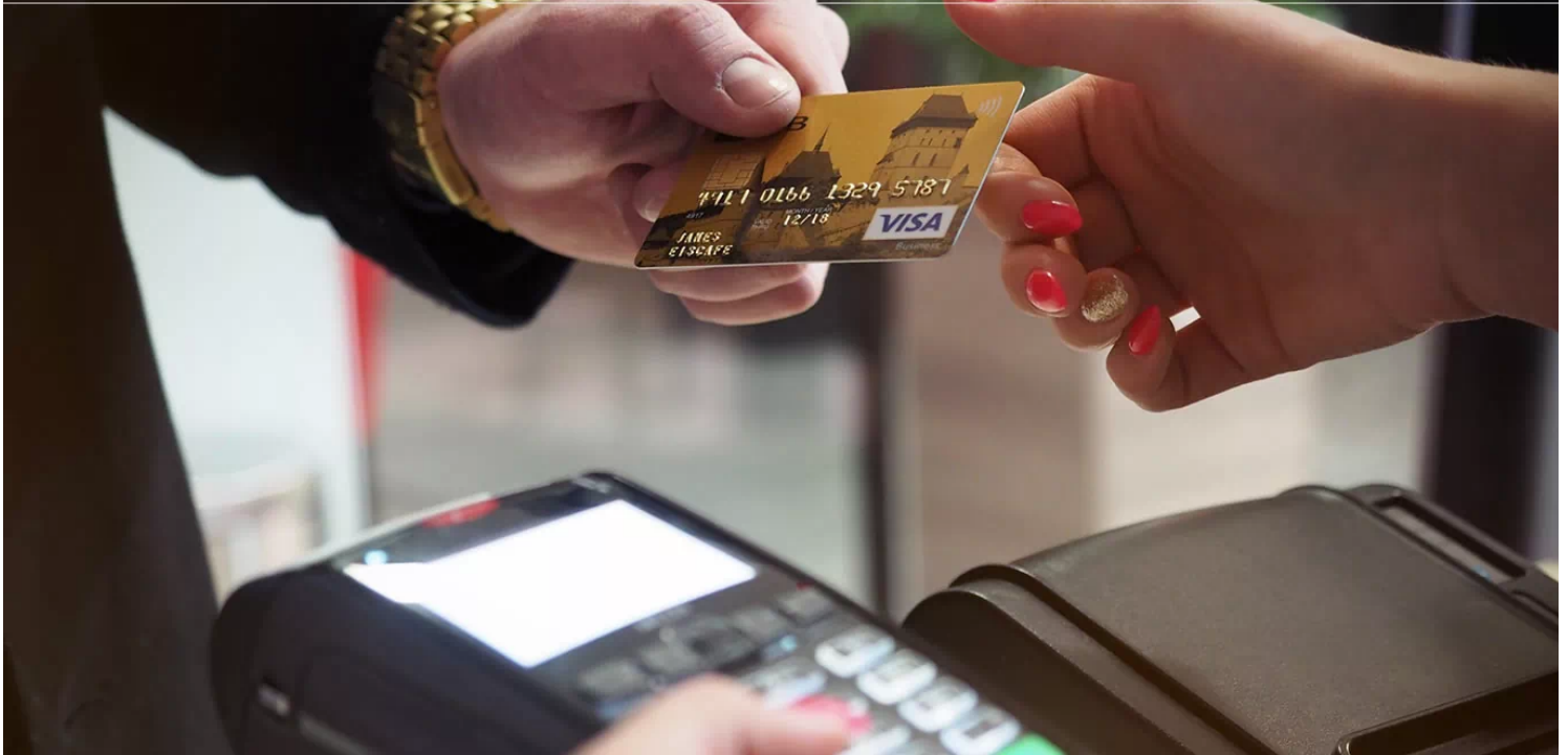
Una cuenta bancaria offshore es el primer paso en tu Plan B de supervivencia financiera

BANCOS | CUENTAS BANCARIAS | JURISDICIONES | IMPUESTOS | DIVISAS